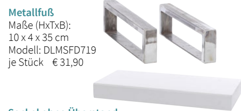
Metallfuß Maße (HxTxB): 10 x 4 x 35 cm Modell: DLMSFD719 je Stück € 31,90 Sockel ohne Überstand Maße (HxTxB): 10 x 41 x 90 cm Modell: DLMSBD715MW € 55,90