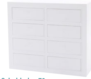
8er Schubladen 78 Maße (HxTxB): 78 x 39 x 90 cm Modell: DLM781S8D701W € 419,90