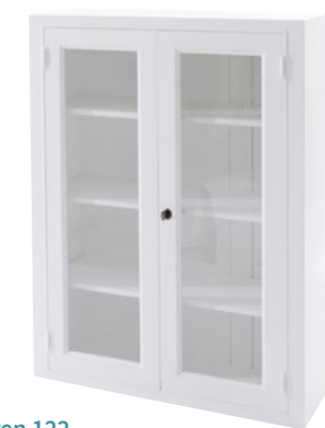
Glastüren 122 Maße (HxTxB): 122 x 39 x 90 cm Modell: DLM12221TD707W € 329,90