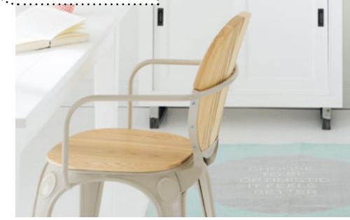
BÜROSCHRANK € 722,50

2 Büroschrank ca. 208 x 39 x 90 cm, Modell: QDLM60BS € 722,50 €