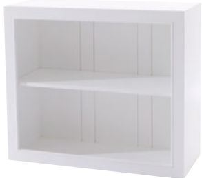
Regal 78 Maße (HxTxB): 78 x 39 x 90 cm Modell: DLM785OMD704W € 199,90