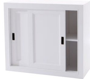
Holzschiebetüren 78 Maße (HxTxB): 78 x 39 x 90 cm. Modell: DLM783STD702W € 249,90