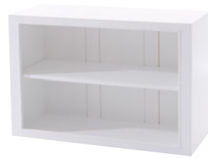
Regal 60 Maße (HxTxB): 60 x 39 x 90 cm Modell: DLM603OMD711W € 198,90