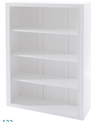
Regal 122 Maße (HxTxB): 122 x 39 x 90 cm Modell: DLM1223OMD708W € 289,90