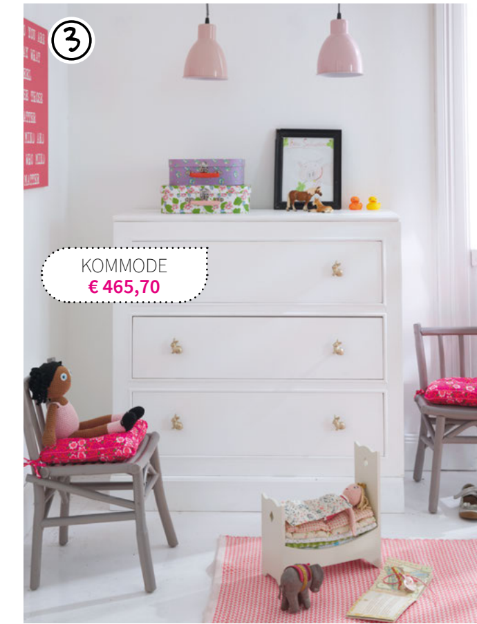
KOMMODE € 465,70

3 Kommode, ca. 90 x 41 x 90 cm, Modell: QDLM78KK € 465,70 € (Preis ohne Griffe)