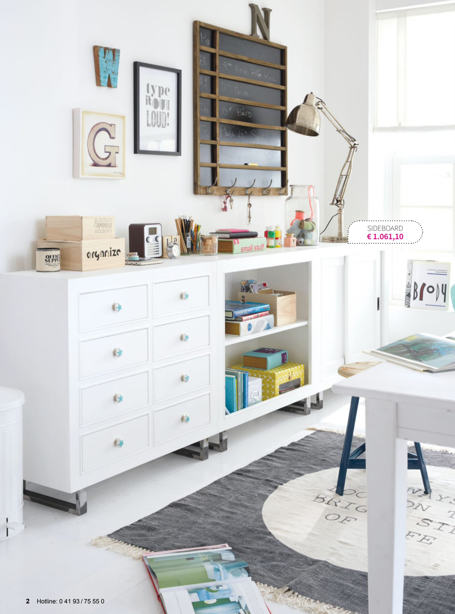
SIDEBOARD € 1.061,10

1 Sideboard ca. 88 x 39 x 270 cm, Modell: QDLM78A € 1.061,10 € (Preis ohne Griffe)