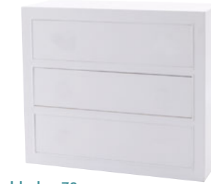
3er Schubladen 78 Maße (HxTxB): 78 x 39 x 90 cm Modell: DLM782S3D700W € 379,90