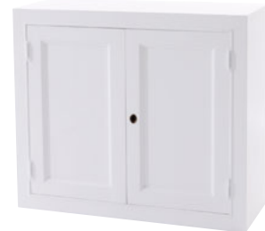
Holztüren 78 Maße (HxTxB): 78 x 39 x 90 cm Modell: DLM7842TD703W € 235,90