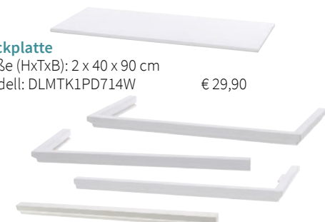
Deckplatte Maße (HxTxB): 2 x 40 x 90 cm Modell: DLMTK1PD714W € 29,90