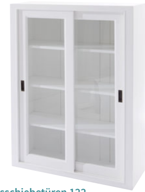
Glasschiebetüren 122 Maße (HxTxB): 122 x 39 x 90 cm Modell: DLM1222STD706W € 339,90