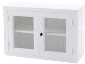
Glastüren 60 Maße (HxTxB): 60 x 39 x 90 cm Modell: DLM6012TD710W € 205,90