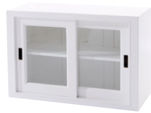
Glasschiebetüren 60 Maße (HxTxB): 60 x 39 x 90 cm Modell: DLM602STD709W € 209,90